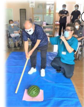
美味しく食べました